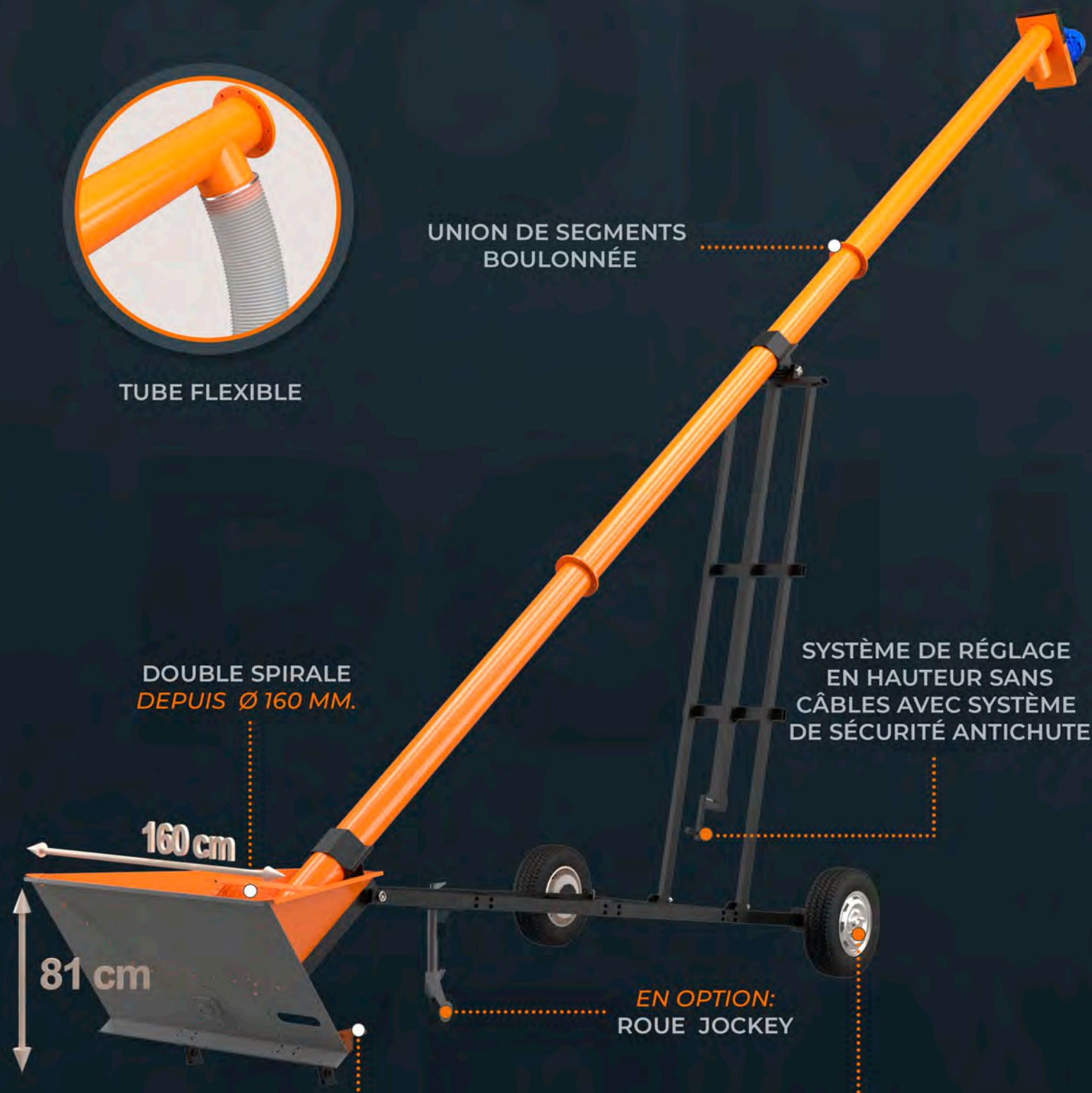
DOUBLE SPIRALE DEPUIS Ø 160 MM.